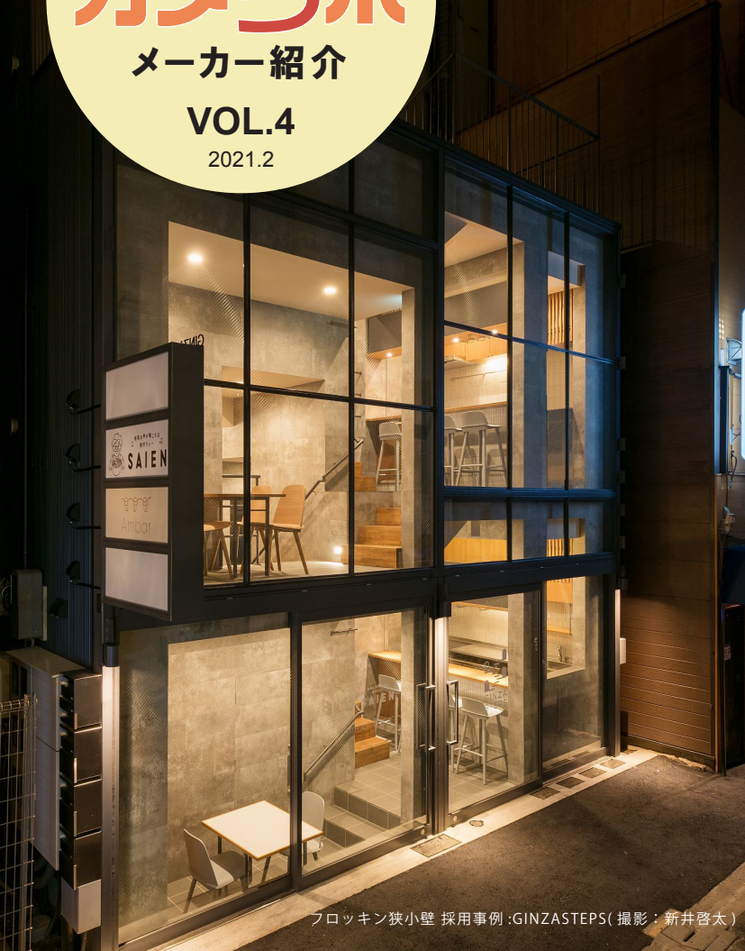
フロッキン狭小壁 採用事例:GINZASTEPS