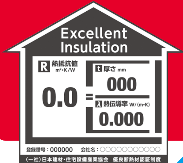
優良断熱材認証 (EI) マーク