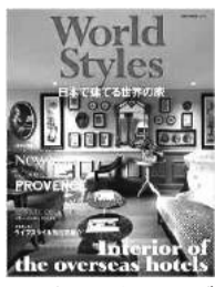
▲発行元はネコ・パブリッシング

日本で建てる世界の家』(NEKO M OOK)が発刊された。同書には、輸入建材商社のサンタ通商(東京都渋谷区)が運営する輸入住宅FCブランド「MAPLE HOMES (メープルホームズ)」が手掛けた住宅が多数紹介されている。全国各地で住まう人のライフスタイルや価値観を反映して建てられた住宅は、個性的な仕上がりとなっている。